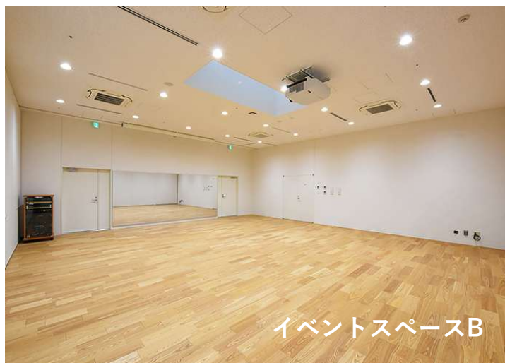
イベントスペースB