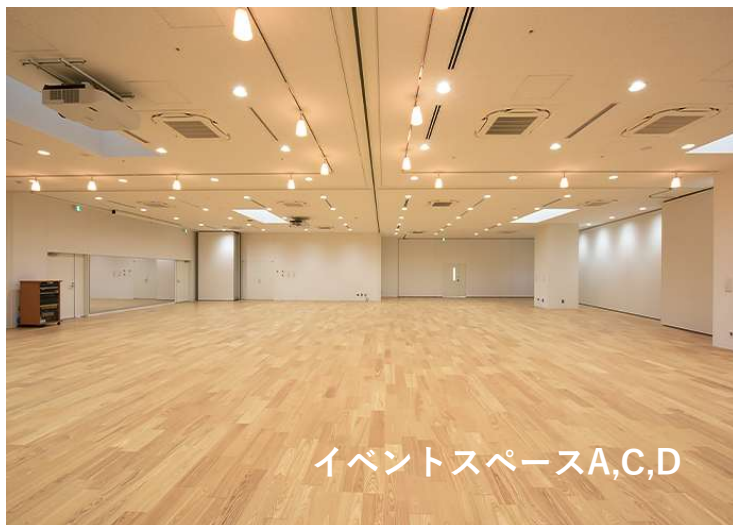
イベントスペースA,C,D