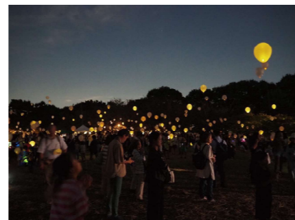
9月30日いこいの森公園 「ユメバルーンを夜空へ」

参加して良かったと感じたことは、私たち団体のことを多くの方が知ってくださるきっかけになったことです。イベント当日、予想以上にたくさんの方が足を運んでくださり、嬉しい限りでした。そして何よりもこれまで関わってくださった方に支えられ、この事業を行うことができたと感じています。本団体のミッションとしても掲げている「人と人とのつながり」を実感することができた事業になりました。