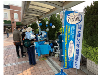
4月2日田無駅前 DJが音楽を鳴らしながら 楽しくライトアップ