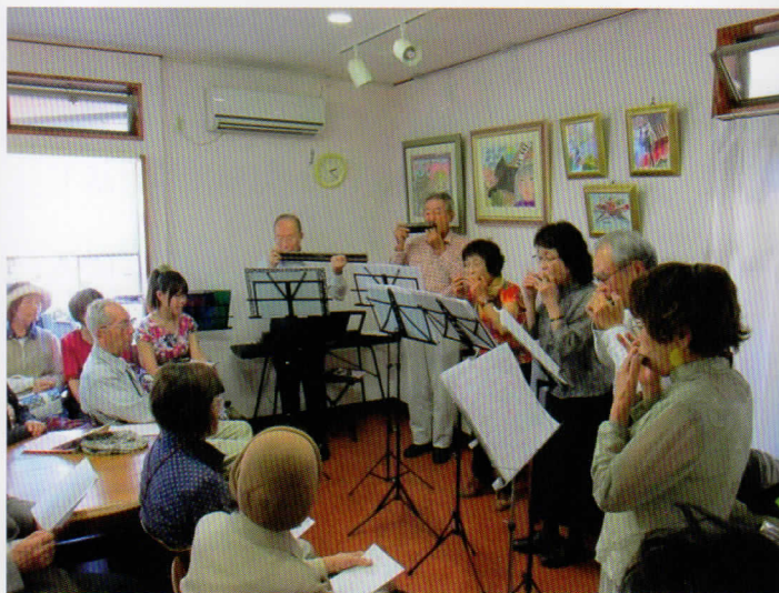
ハーモニカ演奏会やコンサートを開催

お散歩にお出かけください。 そして 仙人の家で一服。 ゆっくりお話ししましょう。