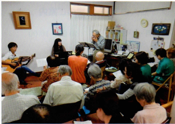
生伴奏による歌声喫茶