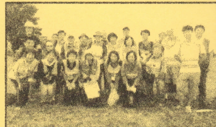
2015年度総合防災訓練にて

<西東京市社会福祉協議会「平成27年度地域福祉活動助成金」対象事業として活動しています>